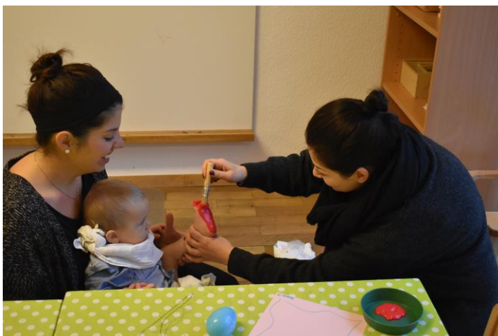
Fußabdruck in der Kinderkrippe