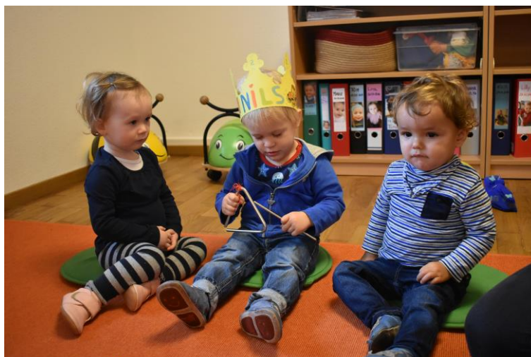
Geburtstag in der Kinderkrippe