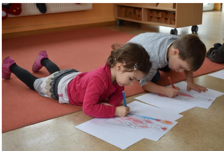
Malen im Liegen