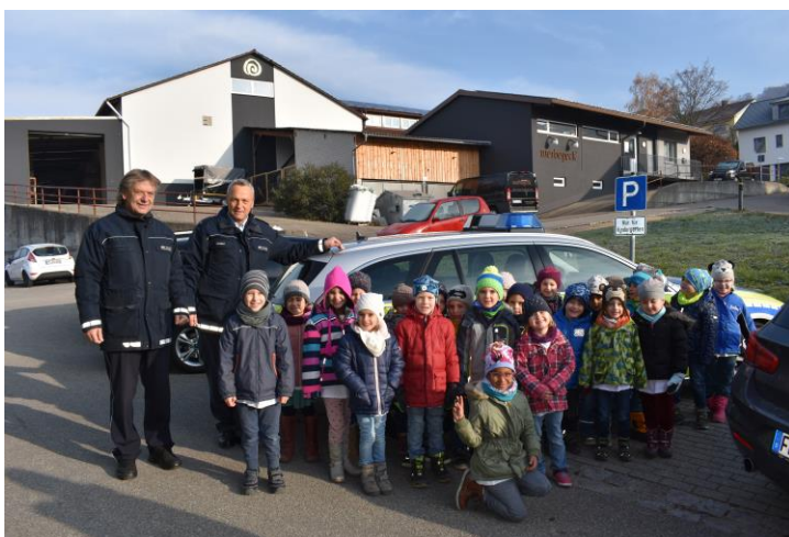
Besuch der Verkehrspolizei Freiburg